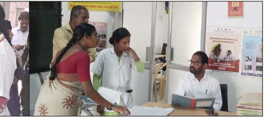
ಬಡ ರೋಗಿಗಳಿಗೆ ಸರ್ಕಾರದ ಸೌಲಭ್ಯಗಳು ಸಮರ್ಪಕವಾಗಿ ದೊರೆಯಬೇಕು, ಎಲ್‌ಬಿಎಸ್ ನಗರ ಪ್ರಾಥಮಿಕ ಆರೋಗ್ಯ ಕೇಂದ್ರಕ್ಕೆ ಭೇಟಿ ನೀಡಿ ಆಸ್ಪತ್ರೆಯ ಸ್ವಚ್ಛತೆ, ಸಿಬ್ಬಂದಿಗಳ ಹಾಜರಾತಿ ಹಾಗೂ ಔಷಧಿಗಳ ಲಭ್ಯತೆ ಕುರಿತು ಪರಿಶೀಲನೆ ನಡೆಸಿದರು.