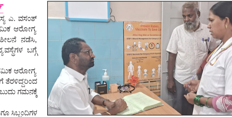
ರೋಗಿಗಳ ಸಂಖ್ಯೆಗೆ ತಕ್ಕಂತೆ ಸೌಲಭ್ಯಗಳಿಲ್ಲದ ರೋಗಿಗಳು ಸಂಕಷ್ಟ ಅನುಭವಿಸುತ್ತಿದ್ದಾರೆ ಎಂದು ಹೇಳಿದರು.