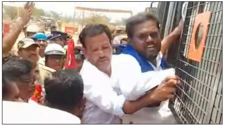
■ ಕನ್ನಡ ಮಾತೃ ಭೂಮಿ ವಾರ್ತೆ

ಬಳ್ಳಾರಿ, ಏ.27 -ಕೆಎಎಚ್‌ಬಿಯು ಜಿಂದಾಲ್ ಕಂಪನಿ ಜೊತೆ ಮಾಡಿಕೊಂಡಿರುವ ಕಾನೂನು ಬಾಹಿರ ರಿಯಲ್ ಎಸ್ಟೇಟ್ ಮಾರಾಟವನ್ನು ರದ್ದುಪಡಿಸಬೇಕು ಸುಪ್ರೀಂ ಕೋರ್ಟ್ ತೀರ್ಪಿನಂತೆ ಪರಿಹಾರ ಒದಗಿಸಿ ಕೈಗಾರಿಕೆಗಳನ್ನು ಸ್ಥಾಪಿಸಬೇಕು ಆಗ್ರಹ ರೈತರಿಗೆ ಅವರ ಭೂಮಿಯನ್ನು ವಾಪಸು ಮಾಡಬೇಕು. ಬೇಷರತ್ತಾಗಿ ಬಂಧಿಸಿ ಎಲ್ಲಾ ರೈತ ಮುಖಂಡರು ಹಾಗೂ ರೈತರನ್ನು ಬಿಡುಗಡೆ ಗೊಳಿಸಿ ಮುಖ್ಯಮಂತ್ರಿಗಳ ಅಧ್ಯಕ್ಷತೆಯಲ್ಲಿ ತಕ್ಷಣ ಹೋರಾಟ ನಿರತರ ಜೊತೆ ಮಾತುಕತೆ ನಡೆಸಿ ಸೂಕ್ತ ಪರಿಹಾರವನ್ನು ರೂಪಿಸಬೇಕು ಎಂದು ಕರ್ನಾಟಕ