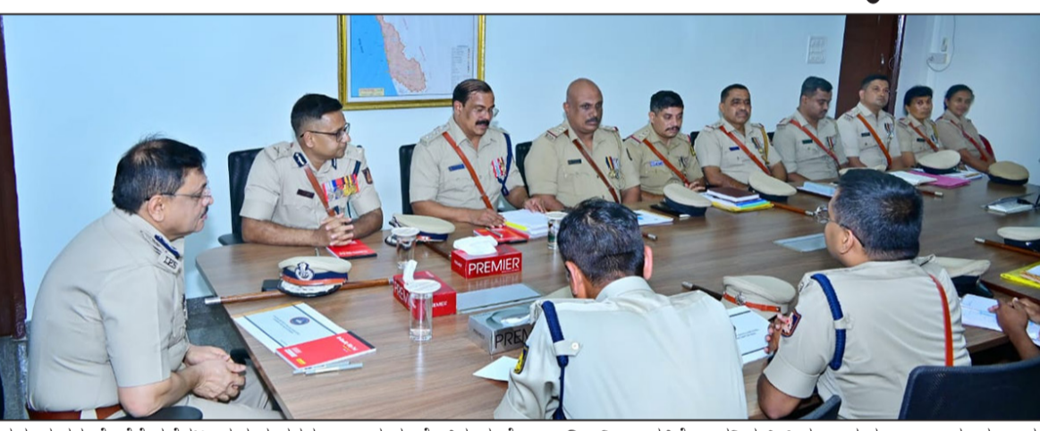
ಹೆಚ್ಚುವರದ ಜೊತೆಗೆ ತಡೆಗಟ್ಟುವ ಕ್ರಮಗಳನ್ನು ಬಲಪಡಿಸಬೇಕು. ಅಪರಾಧ ಪ್ರಕರಣಗಳನ್ನು ಕಾಲಮಿತಿಯೊಳಗೆ ಇತ್ಯರ್ಥಗೊಳಿಸುವಂತೆ ಅಧಿಕಾರಿಗಳಿಗೆ ಸೂಚಿಸಿದರು. ಆಸರೆ ಕಾರ್ಯಕ್ರಮವನ್ನು ತಾವು ಉಡುಪಿ ಜಿಲ್ಲಾ ಎಸ್‌ಐ ಆಗಿದ್ದ ಸಂದರ್ಭದಲ್ಲಿ ಪರಿಚಯಿಸಿದ್ದು, ಈಗ ರಾಜ್ಯಾದ್ಯಂತ ಆನುಷ್ಠಾನಗೊಳ್ಳುತ್ತಿದೆ ಎಂದರು. ಉಡುಪಿ ಜಿಲ್ಲೆಯಲ್ಲಿ ಈ ಕಾರ್ಯಕ್ರಮವನ್ನು