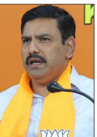
ಬಿಟ್ಟುನಿಂತ ಮುಖ್ಯಮಂತ್ರಿ ಸಿದ್ದರಾಮಯ್ಯ ಹಾಗೂ ಉಪಮುಖ್ಯಮಂತ್ರಿ ಡಿ.ಕೆ.ಶಿವಕುಮಾರ್ ವೈಯಕ್ತಿಕ ಪ್ರತಿಷ್ಠೆಯಲ್ಲಿ ಮುಳುಗಿ ಹೋಗಿದ್ದಾರೆ. ಇದರ ನೇರ ಪರಿಣಾಮ ರಾಜ್ಯದ ಜನರ ಮೇಲಾಗುತ್ತಿದೆ ಎಂದು ಟೀಕಿಸಿದ್ದಾರೆ. ಸರ್ಕಾರಿ ನೌಕರರಿಗೆ ಸಂಬಳವನ್ನೇ ಕೊಡಲು ಸಾಧ್ಯವಾಗದೆ ಈ ಸರ್ಕಾರ, ಈ ವರ್ಷ ಬಿರು ಬೇಸಿಗೆ ಹಾಗೂ ಬರದ ಛಾಯೆಯಲ್ಲಿ ಈಗಾಗಲೇ ಬಸವಳಿದು ಹೋಗಿರುವ ರಾಜ್ಯದ ಜನರನ್ನು ದೇವರ ಕಾಪಾಡಬೇಕು. ಪ್ರತಿಪಕ್ಷವಾಗಿ ಬಿಜೆಪಿ ಸರ್ಕಾರವನ್ನು ಬಡಿದಿಟ್ಟು ಕುಡಿಯುವ ನೀರಿಗೂ ಪರಿಶ್ರಮಿಸುತ್ತಿರುವ ಜನ, ಜಾನುವಾರು ನೆರವಿಗೆ ಮುಂದಾಗುವಂತೆ ಹೋರಾಟ ನಡೆಸಲು ಬದ್ಧವಾಗಿದೆ ಎಂದಿದ್ದಾರೆ.

ಬೆಂಗಳೂರು, ಎ.22 -ಸಿದ್ದರಾಮಯ್ಯ ನವ ರ ಅಧಿಕಾರಿ ನೀತಿ ವೈಫಲ್ಯದ ಒನ್ನಲೆಯಲ್ಲಿ ಎಪ್ರಿಲ್ ತಿಂಗಳ 22ರವರೆಗೆ ಬಹುತೇಕ ಸರ್ಕಾರಿ ನೌಕರರಿಗೆ ರಾಜ್ಯ ಸರ್ಕಾರ ಸಂಬಳ ವನ್ನೇ ಕೊಟ್ಟಿಲ್ಲ ಎಂದು ಬಿಜೆಪಿ ರಾಜ್ಯಾಧ್ಯಕ್ಷ ಬಿ.ವೈ.ವಿಜಯೇಂದ್ರ ಆರೋಪಿಸಿದರು. ಇಂದು ಎಕ್ಸ್‌ನಲ್ಲಿ ಫೋನ್ ಮಾಡಿ ರುವ ಅವರು, ರಾಜ್ಯ ಕಾಂಗ್ರೆಸ್ ಸರ್ಕಾರದ ದುರಾಡಳಿತ, ಮುಖ್ಯಮಂತ್ರಿ ಸಿದ್ದರಾಮಯ್ಯನವರ ಅಧಿಕಾರ ನಿಂತಿರುವ ವೈಫಲ್ಯ ಹಾಗೂ ಅಡಳಿತದಲ್ಲಿ ಭ್ರಷ್ಟಾಚಾರ ತಾಂಡವವಾಡುತ್ತಿದೆ. ಇದರ ಪರಿಣಾಮವಾಗಿ ರಾಜ್ಯದ ಸುಮಾರು 5 ಲಕ್ಷ ಸರ್ಕಾರಿ ನೌಕರರ ಪೈಕಿ ಬಹುತೇಕ ನೌಕರರಿಗೆ ಎಪ್ರಿಲ್ ತಿಂಗಳ 22ರವರೆಗೆ ಸರ್ಕಾರ ಸಂಬಳವನ್ನೇ ನೀಡಿಲ್ಲ ಎಂದು ದೂರಿದ್ದಾರೆ. ಕಳೆದ ವರ್ಷ ಎರಡು ತಿಂಗಳ ಅವಧಿಗೆ ಗೃಹಲಕ್ಷಿ ಪಣವನ್ನೇ ನುಂಗಿ ಹಾಕಿದ ಸರ್ಕಾರ, ಈ ವರ್ಷ ಬಾಗಲಕೋಟೆ ಹಾಗೂ ದಾವಣಗೆರೆ ದಕ್ಷಿಣ ವಿಧಾನಸಭಾ ಕ್ಷೇತ್ರಗಳ ಚುನಾವಣೆಯ ಕಾರಣಕ್ಕಾಗಿ ಮಾರ್ಚ್ ಅಂತ್ಯಕ್ಕೆ ಖಜಾನೆಯಲ್ಲಿ ದುರವಸ್ಥೆ ಗೃಹಲಕ್ಷಿ ಫಲಾನುಭವಿಗಳಿಗೆ ಹಂಚಿದೆ. ಪರಿಣಾಮ, ಸರ್ಕಾರದ 5 ಲಕ್ಷ ಸರ್ಕಾರಿ ನೌಕರರಿಗೆ ತಿಂಗಳು ಕಳೆಯುತ್ತಾ ಬಂದರೂ ಸಂಬಳ ಕೊಡಲು ಸರ್ಕಾರಕ್ಕೆ ಸಾಧ್ಯವಾಗಿಲ್ಲ ಎಂದು ಆರೋಪಿಸಿದ್ದಾರೆ. ಮುಖ್ಯಮಂತ್ರಿಗಳ ಬದಲಾವಣೆ, ಸಂಪುಟ ಪುನರ್ರಚನೆ, ಮುಸ್ಲಿಮರ ತುಷ್ಟೀಕರಣ ಹೀಗೆ ಹಲವು ಅಂತರ