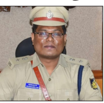
ಜನವರಿಯಲ್ಲಿ 1 ಕೇಸ್‌ನಲ್ಲಿ ಒಬ್ಬ ಆರೋಪಿಯಿಂದ 4500 ರೂ.ನಗದು ಹಾಗೂ 1 ಮೊಬೈಲ್ ಫೋನ್ ವಶಪಡಿಸಿಕೊಳ್ಳಲಾಗಿದೆ.

■ ಕನ್ನಡ ಮಾತೃ ಭೂಮಿ ವಾರ್ತೆ ರಾಯಚೂರು, ಏ.7-ಜಿಲ್ಲೆಯಲ್ಲಿ ಕ್ರಿಕೆಟ್ ಬೆಟ್ಟಿಂಗ್ ಗೆ ಸಂಬಂಧಿಸಿದಂತೆ ಪೊಲೀಸ್ ಇಲಾಖೆಯಿಂದ ಕಳೆದ 4 ತಿಂಗಳಲ್ಲಿ ದಾಖಲೆ ನಡೆಸಿ ಒಟ್ಟು 26 ಕೇಸ್ ಗಳನ್ನು ದಾಖಲಿಸಲಾಗಿದೆ ಎಂದು ಜಿಲ್ಲಾ ಪೊಲೀಸ್ ವರಿಷ್ಠಾಧಿಕಾರಿ ಅರುಣಾಂಗ್ನು ತಿಳಿಸಿದರು. ಈ ಬಗ್ಗೆ ಮಾಧ್ಯಮ ಹೇಳಿಕೆ ನೀಡಿರುವ ಅವರು, ಕಳೆದ ಜನವರಿಯಿಂದ ಈವರೆಗೆ ಒಟ್ಟು 26 ಕ್ರಿಕೆಟ್ ಬೆಟ್ಟಿಂಗ್ ಪ್ರಕರಣಗಳನ್ನು ದಾಖಲಿಸಲಾಗಿದ್ದು, ಅದರಲ್ಲಿ 70 ಜನ ಆರೋಪಿಗಳಿಂದ 87,110 ರೂ. ನಗದು ಹಣ ಹಾಗೂ ಬೆಟ್ಟಿಂಗ್ ಬಳಸುತ್ತಿದ್ದ 86,400ರೂ. ಬೆಲೆ ಬಾಳುವ 20 ಮೊಬೈಲ್ ಫೋನ್ ಗಳನ್ನು ವಶಪಡಿಸಿಕೊಳ್ಳಲಾಗಿದೆ.